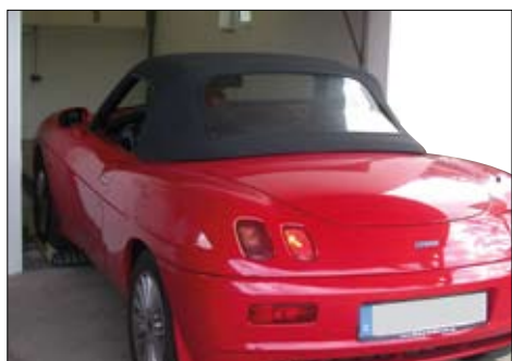
Parkboy™ paßt für jeden PKW...