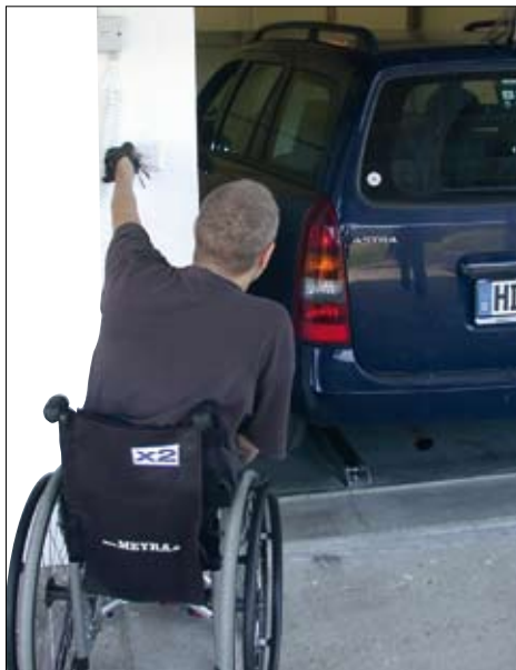
Zentimetergenaues, automatisches Einparken per Knopfdruck.