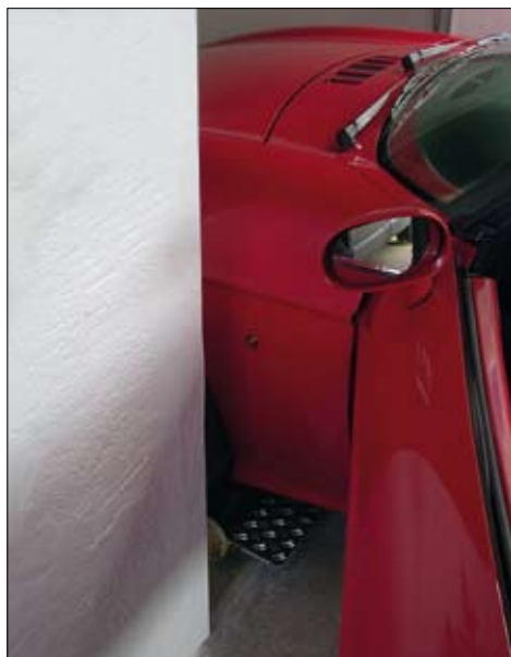
Fahrtürre lässt sich bei jedem PKW vollständig öffnen!