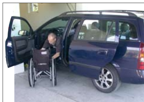
Komfortabler Ausstieg vor der Garage.

Das automatische Garagen-Parksystem für schmale, enge Garagen. Parkboy™ paßt für jedes Auto und jede Garage! Sie steigen bequem vor Ihrer Garage aus dem PKW und Parkboy™ transportiert automatisch per Knopfdruck Ihr Fahrzeug in die korrekte, platzsparende Garagen-Parkposition. Benötigen Sie Ihr Auto: Knopfdruck genügt und Parkboy™ „liefert“ Ihr Auto innerhalb von ca. 60 Sekunden wieder