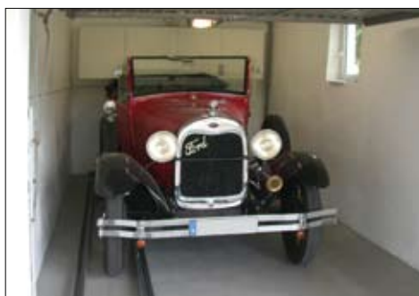
...egal ob modern oder alt.